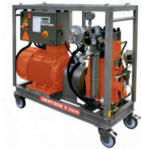
Nagynyomású rendszerek – 2500 barig