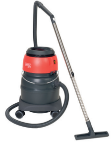
Ipari por- és vízszívók