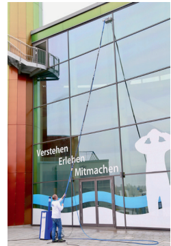
Homlokzattisztítás földről 20 méter magasságig